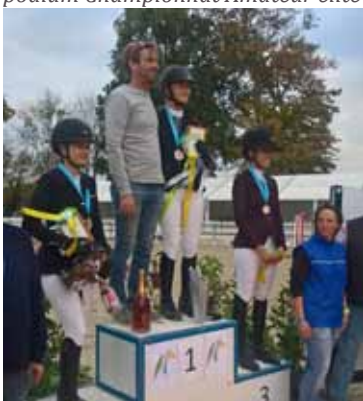
podium Championnat Amateur 2