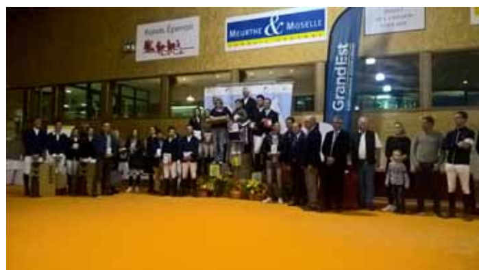
Podium Amateur 2