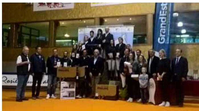
Podium Amateur élite