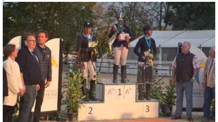
podium Championnat Amateur 1