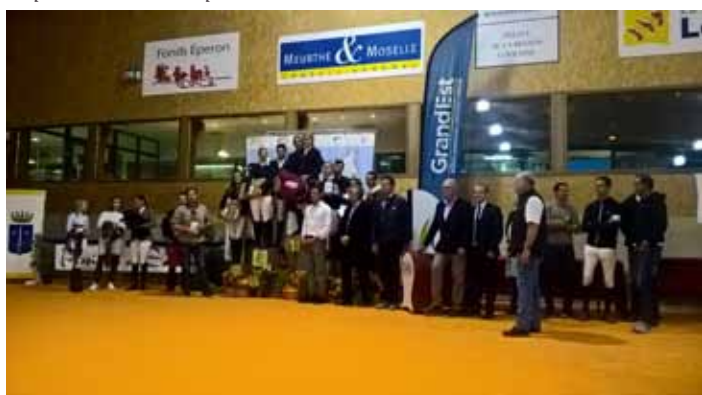
Podium Amateur 1