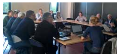
Table ronde 3 : des compétitions optimisées par l'action territoriale

- Règlements peu respectés, comportements inappropriés des cavaliers ou coaches, manque de respect des OdC. Proposition de mise en place d'une charte, d'appliquer plus souvent les sanctions prévues au règlement, de considérer les cavaliers comme des sportifs avant tout plutôt que des clients, développer les contrôles anti dopage (chevaux/cavaliers) et d'identité (cavaliers), créer des vidéos et affiches pédagogiques. - Désigner pour chaque concours un représentant des cavaliers comme cela existe en CCE. Nomination des Président-es de Jury par la FFE pour une meilleure indépendance. Créer des «packs coaches» avec leurs informations utiles (horaires de passage, plan...) Harmoniser les indemnités des OdC. - Développer l'écologie au sein des compétitions (recyclage, vaisselle durable, tri sélectif). - Respect du cheval (communication vers le public et les pratiquants).