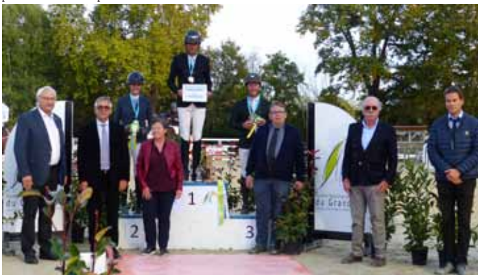
podium Championnat Amateur élite