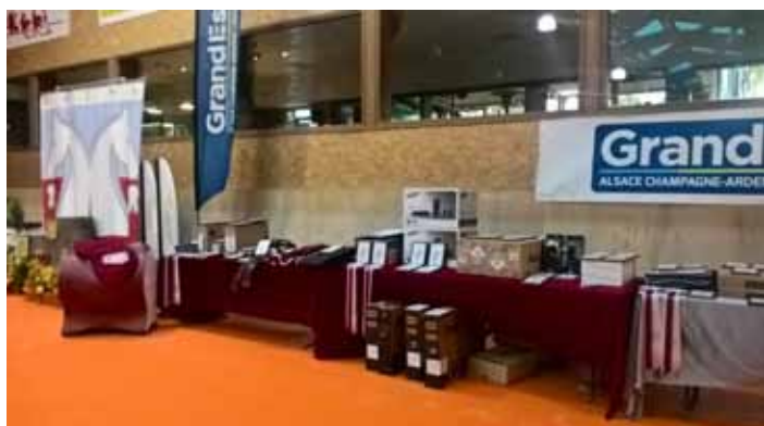
Le plein de cadeaux pour les classés !

Résultats complets sur le site du CRE : www.cregrandest.fr/grand-regional/grand-regional.html