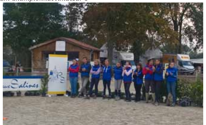
L'équipe dynamique de la MFR Ramonchamp