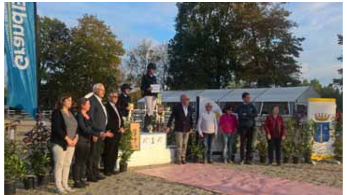
podium critérium PRO 3