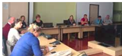
Table ronde 2 : des compétitions respectueuses de l'éthique sportive et économiquement viables

Autres thèmes abordés : l'intérêt de conserver les dotations en Amateur, le service médical (conseillé ou obligatoire), les ordres de passage en SIF (regroupements par clubs), la valeur ajoutée des labels (grand régional, top ten, coupe des clubs...) et comment attirer le grand public sur les concours.