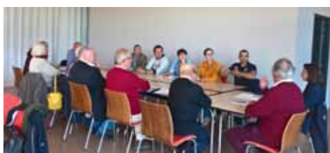
Table ronde 1 : des compétitions qui répondent aux attentes des cavaliers

Trois tables rondes étaient proposées avec une restitution en fin de journée. Voici les principales observations et idées proposées :